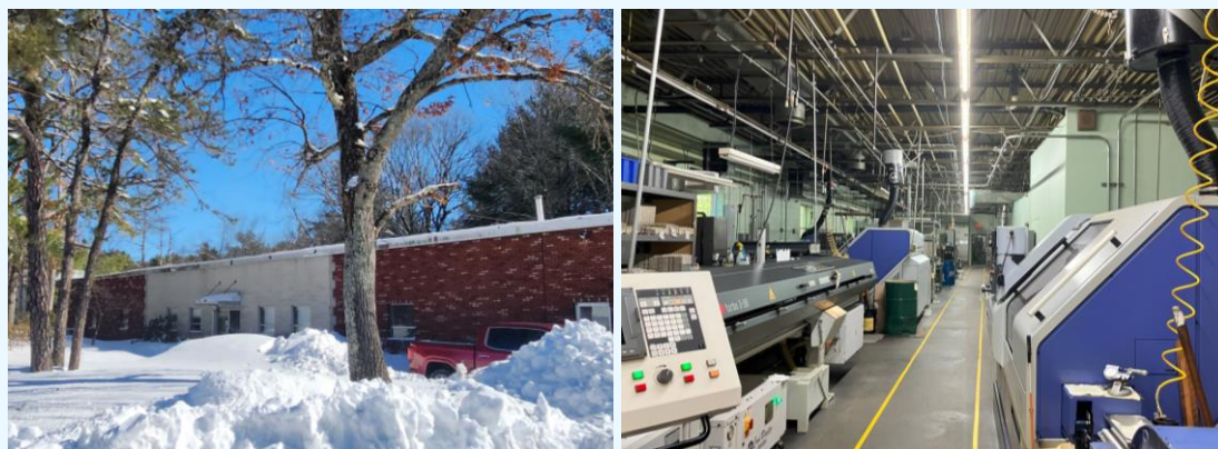
▲ Acra Cut・Intech 本社