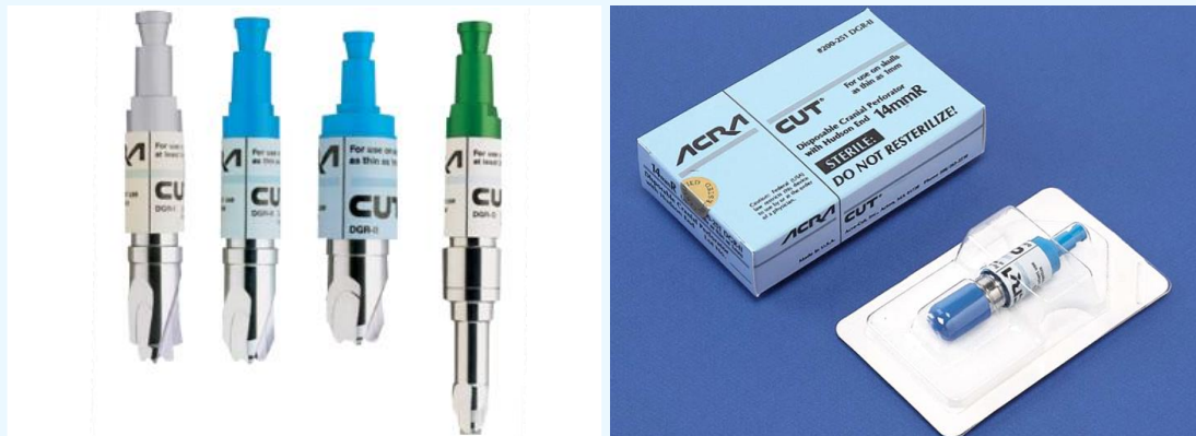
▲ 頭蓋骨穿孔器（パーフォレーター）