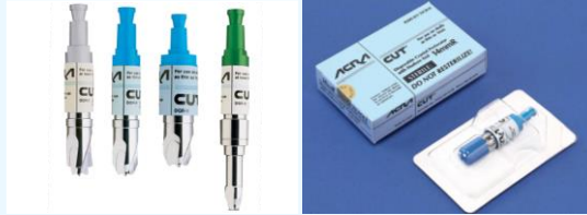
▲ 頭蓋骨穿孔器（パーフォレーター）