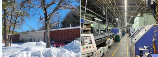
▲ Acra Cut・Intech本社